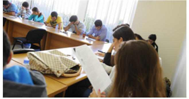
طلّاب السنة الأولى طب في مقرر PPS-1 وحدة "الحكاية والطب"