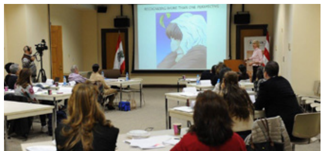
"نزاعات بسيطة، مضاعفات معقدة: حلول ناجحة"