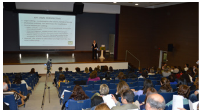
”حل النزاعات في الوسط المدرسي“ في مدرسة الإنترنتاشونال كولج (IC)، رأس بيروت