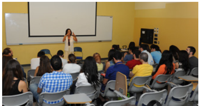
طلّاب السنة الثانية طب في مقرر PPS-2 جلسة رعاية تطبيقية