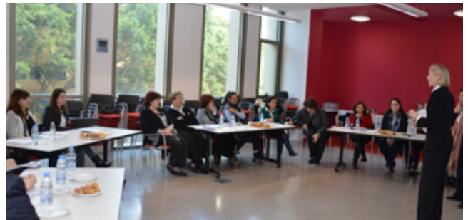
"السعي للتوفيق في الوسط المدرسي"