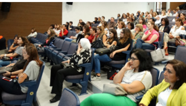
محاضرة ”حماية الطفل 101: إحداه فرق“ في مدرسة الإنترنتاشونال كولج (IC)، رأس بيروت