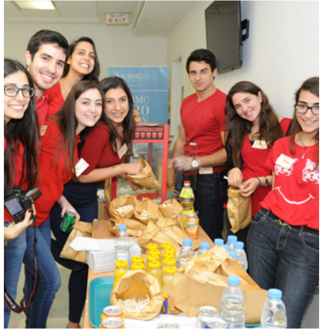
"Pop Talk 1.0": "اهتمّ بالمشاركة" (Care to share)