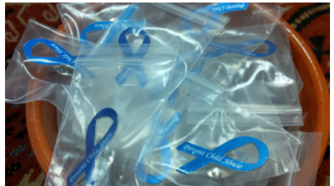
توزيع شارات منع الإساءة للأطفال إلى طلاب السنة الثانية طب في محاضرة ”إساءة معاملة الأطفال“