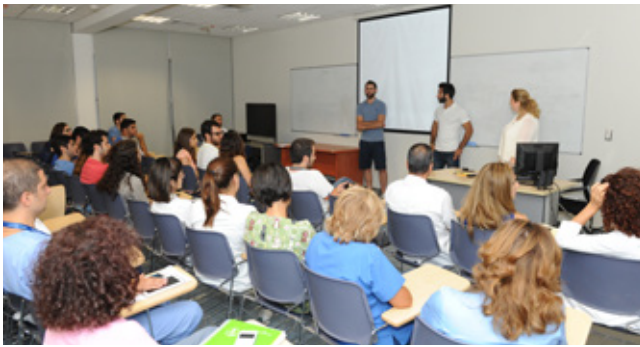
طلّاب السنة الثانية طب في مقرر PPS-2 في جلسة "تجربة تسليط الضوء على الرعاية" (مواكبة الممرضات) "Caring Spotlight Experience"