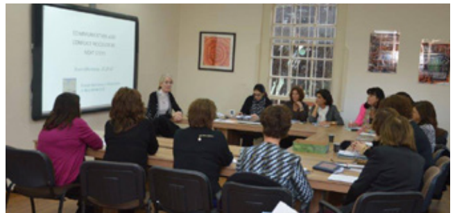
ورشة عمل حول "السعي للتوفيق في الوسط المدرسي"