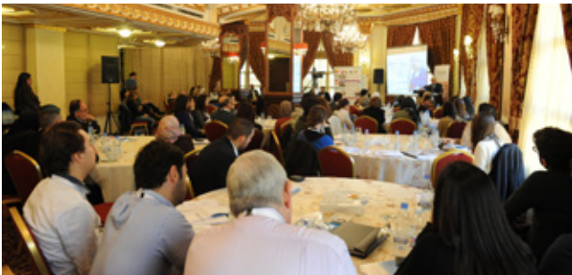
"سوء الممارسة الطبية، الأخطاء والإفشاء عنها"