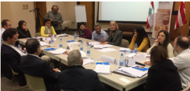
"الكشف عن النتائج الوخيمة والأخطاء: تدريب للمدربين"