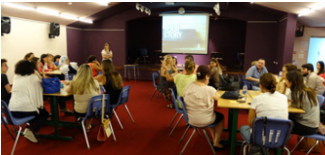
ورشة عمل حول "حماية الطفل"