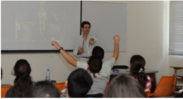
طلّاب السنة الأولى طب في مقرر PPS-1 وحدة "الفن والطب"