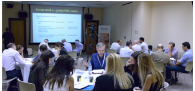
"تقييم الاحترافية في كلية الطب في الجامعة الأميركية في بيروت: حان الوقت"