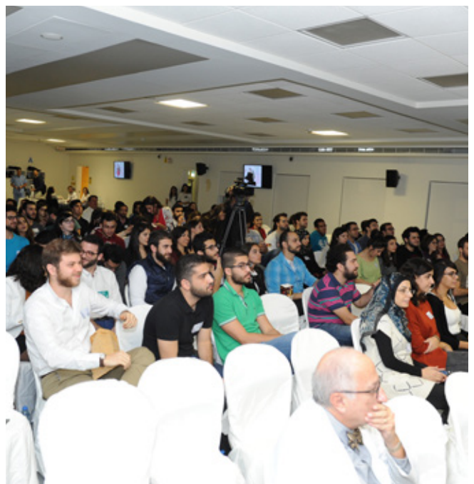
"Pop Talk 2.0": "خلف الرداء الأبيض" (Behind the White Coat)