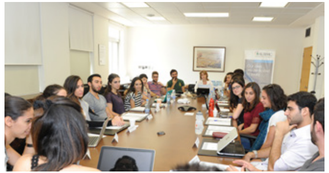
طلّاب السنة الثانية طب في مقرر PPS-2 في جلسة صورية تدريبية للجنة الأخلاقيات