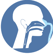
التهوية بالضغط الإيجابي المستمر

هناك نوعان من التهوية الميكانيكية عبر القناع المستخدمة في المنزل. سيحدد لك طبيبك النوع الأكثر ملاءمة بالنسبة لك وفق حالتك الصحية. كما سيحدّد الإعدادات (العيارات) التي عليك إستخدامها.